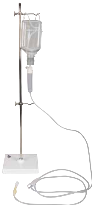
Ancien système de perfusion

Le kit de mise à jour du système de perfusion remplace l'ancien système P50 et son support en métal.