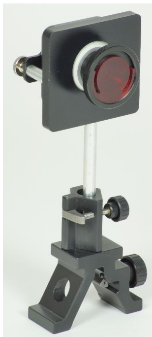
Fig. 2 : Module d'appareil photo monté.