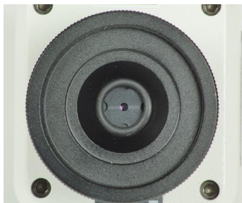
Fig. 1 : Diaphragme inséré dans la lentille de focalisation et fixé avec le joint torique.

Le cas échéant, on peut rajuster horizontalement de quelques millimètres le Moticom dans le support en desserrant légèrement les vis de fixation.